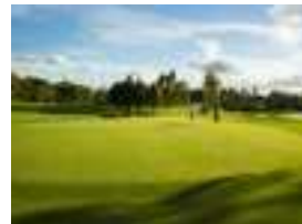
Mt Broughton 高尔夫球俱乐部